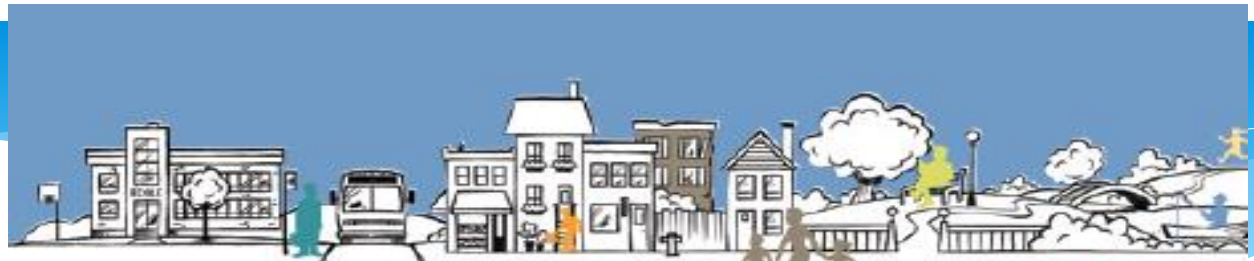
Carte de la santé et de ses déterminants